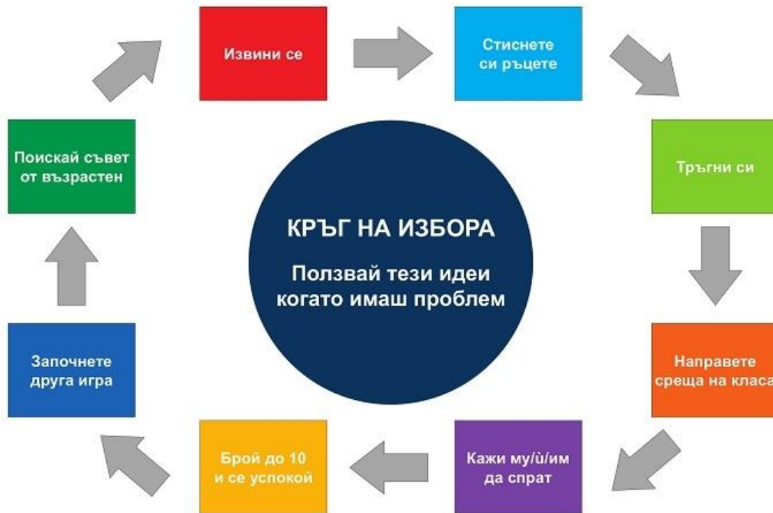
Фигура 2 Кръг на избора, Източник: Център за приобщаващо образование, България

Съществуват и много други практически инструменти и ресурси, които могат да бъдат използвани в този процес и да бъдат поставени на видно място в класната стая. Вижте практическите инструменти в съответните организации във вашата страна. Също така може да обмислите използването на „Кръг на избора“, разработен от „Център за приобщаващо образование“, България, който предлага различни стратегии в случай на конфликт.