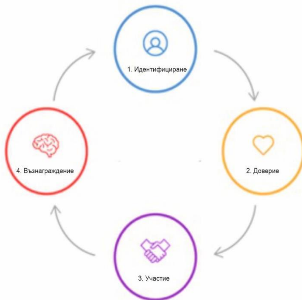
Фигура 4 Процес по изграждане на общност

Обсъдете идеята с най-близките си колеги и се опитайте да привлечете първите си 10 членове според определения от вас профил (учители, психолози, педагогически съветници). За предпочитане е да изберете лидери, формиращи общественото мнение във вашата област, така че те да донесат повече популярност на вашата общност. Насърчавайте първите си членове да канят други хора.