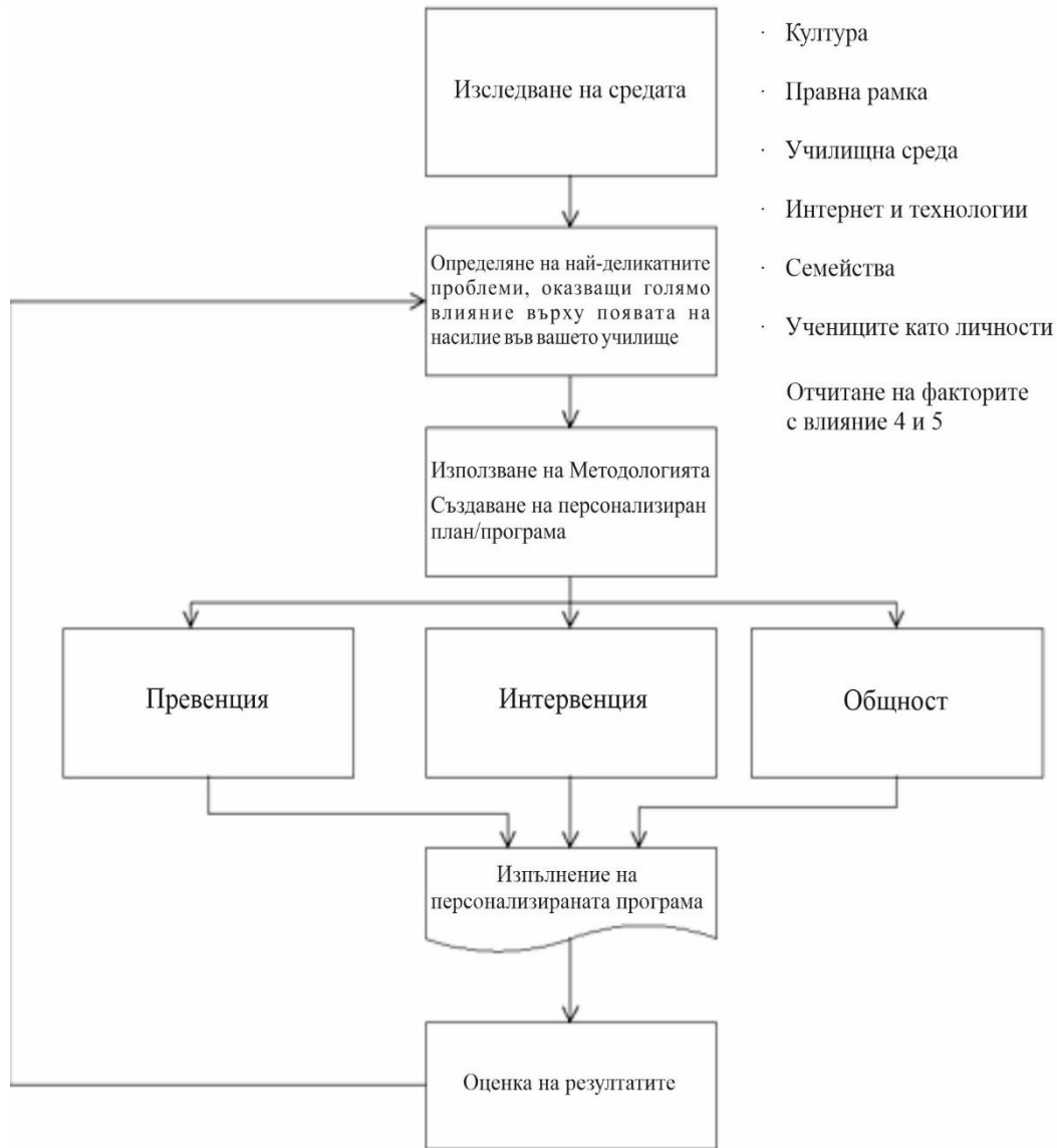
Фигура 1 Как да се използва методологията